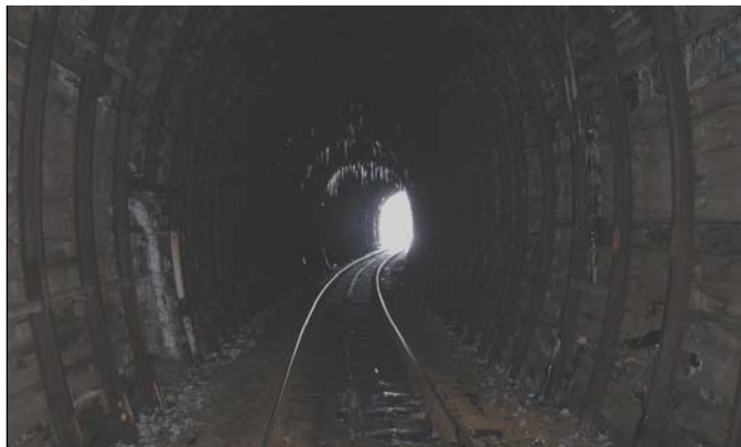
Pohled na ústí tunelu