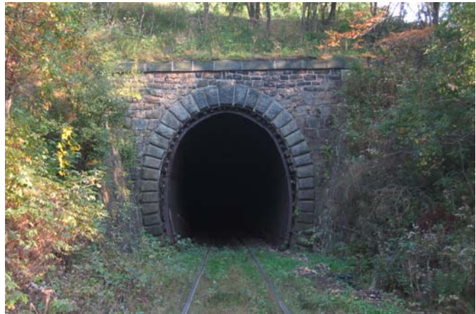
Pohled na portál tunel Mikulovský