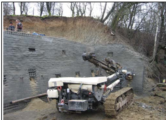
Pohled na zajištění svahu hřebíkováním