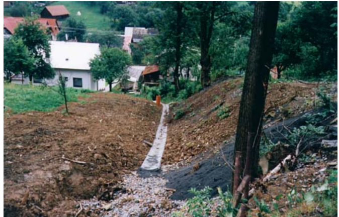
Závěrečné terénní úpravy svahu před zatravněním