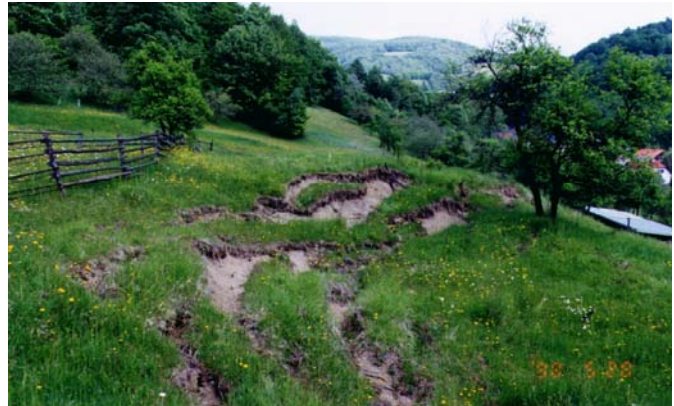
Stav před sanací