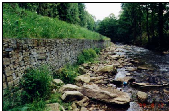
Gabionová opěrná konstrukce