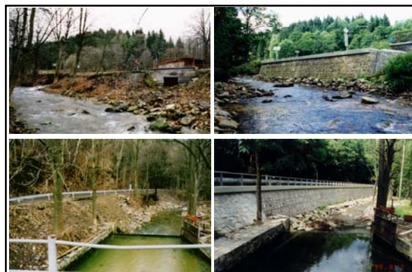
Monolitické zárubní zdi s obkladními prefabrikáty stav před a po rekonstrukci