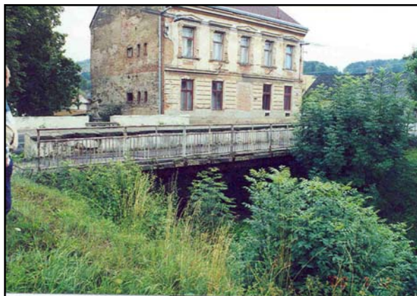
Stav mostu před rekonstrukcí