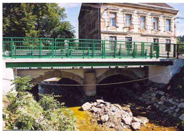
Most po rekonstrukci